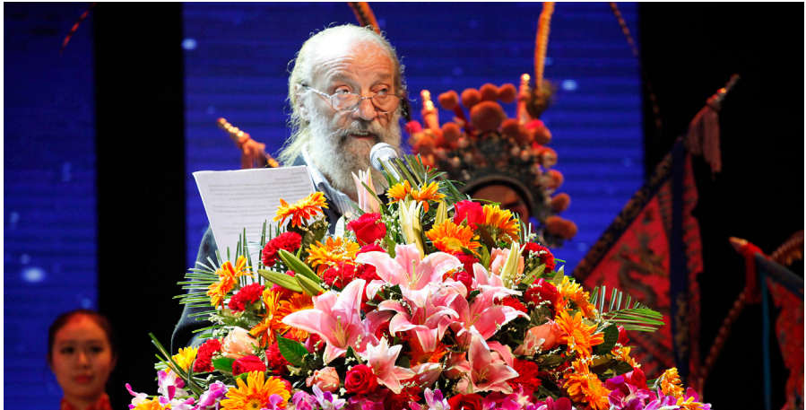
Anatoly VASILIEV, Journée Mondiale du Théâtre 2016 à Guangzhou, Chine