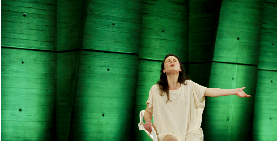
Journée Mondiale du Théâtre 2012 à Paris, France

Le principal enjeu de la Journée mondiale du théâtre est de promouvoir le "théâtre" sous toutes ses formes auprès des professionnels et des citoyens du monde entier. Parmi les autres buts et objectifs, on peut citer