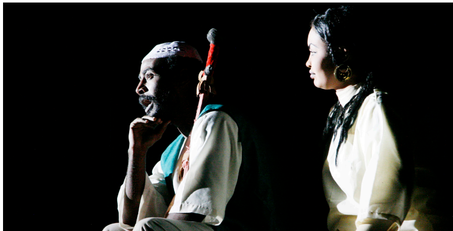
Centre Soudanais de l'ITI 2016

En raison de la multitude de langues qui existent dans le monde entier, et parce que le Message doit être compris par les habitants d'un pays ou d'une région, le Message de la Journée mondiale du théâtre est toujours traduit dans la ou les langues du pays et il en va de même pour la courte biographie de l'auteur.