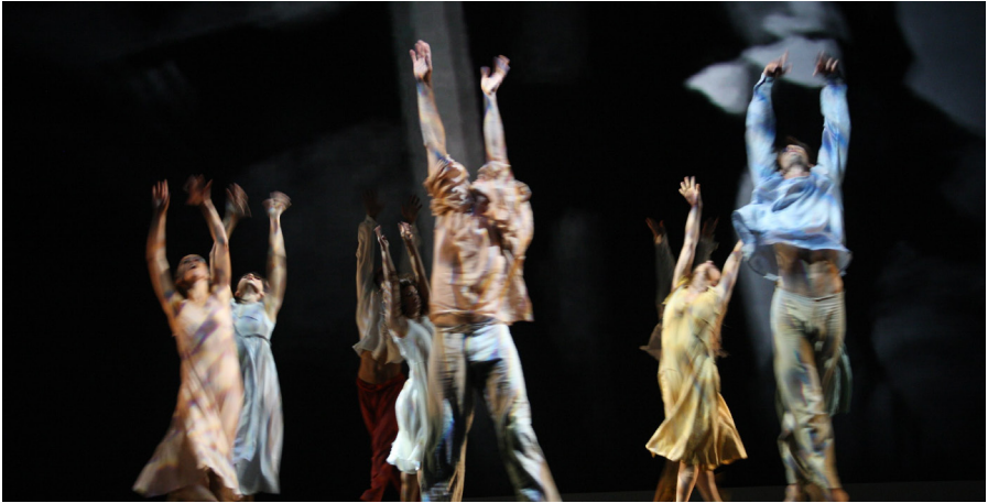
Institut International du Théâtre