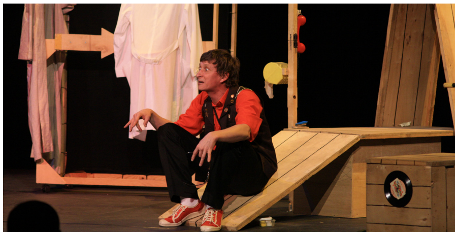
Institut International du Théâtre (événement ITI en 2010)