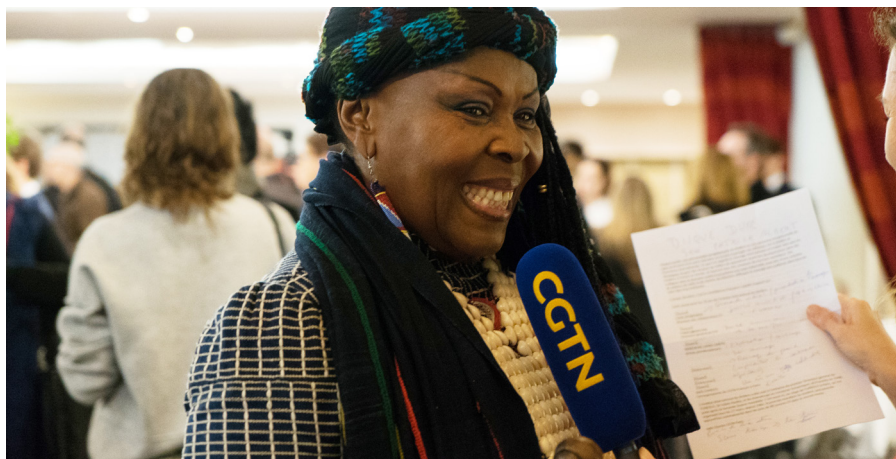
Werewere-Liking GNEPO, Journée Mondiale du Théâtre 2018 à Paris, France

Les Centres de l'ITI, les membres coopérants et les amis sont encouragés à envoyer le Message de la Journée mondiale du théâtre tout type de médias. Les auteurs sont en général disposés à donner des interviews. Si une agence de radio, de télévision, de presse ou d'internet souhaite interviewer l'auteur du Message, veuillez prendre contact avec le Secrétariat général à l'adresse wtd@iti-worldwide.org .