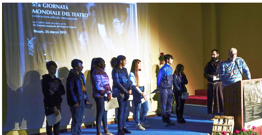
Journée Mondiale du Théâtre 2019 à Pesaro, Italie