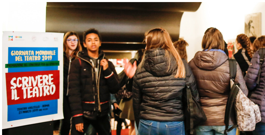
Cérémonie "Scrivere il Teatro", Journée Mondiale du Théâtre 2019 à Rome, Italie