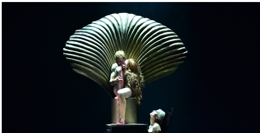
Institut International du Théâtre

La Journée mondiale du théâtre a été créée par l'Institut International du Théâtre ITI, la plus grande organisation mondiale pour les arts de la scène, et a été célébrée pour la première fois le 27 mars 1962.