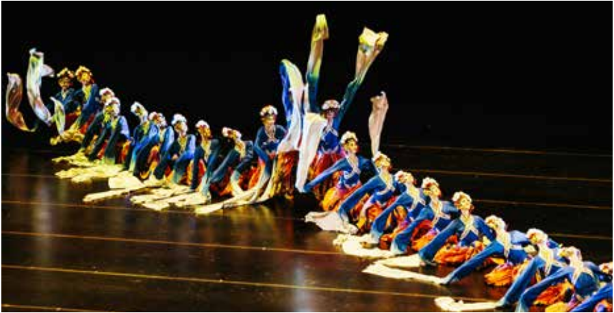
Dance College of Shanghai Theatre Academy, Institut International du Théâtre 2017 à Shanghai, Chine