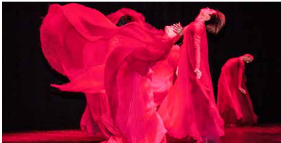
Red par Shanghai Theatre Academy, Journée Internationale de la Danse 2016 à Paris, France