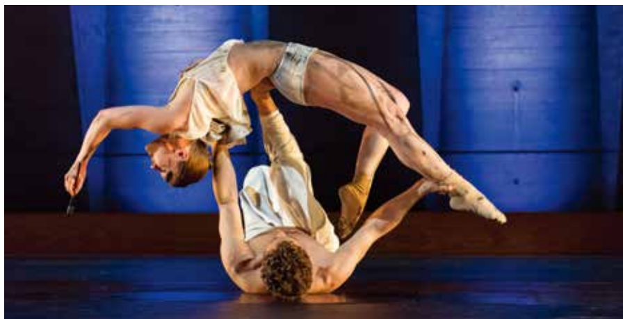
Institut International du Théâtre