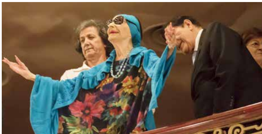
Alicia ALONSO, Journée Internationale de la Danse 2018 à La Havane, Cuba

Les types d'événements organisés autour de la Journée Internationale de la Danse sont aussi nombreux que les idées. Voici une courte liste des principaux :