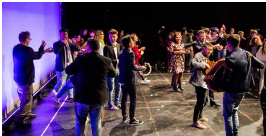
Journée Mondiale du Théâtre 2019 à Rome, Italie

L'Institut International du Théâtre ITI a créé la Journée Mondiale du Théâtre.