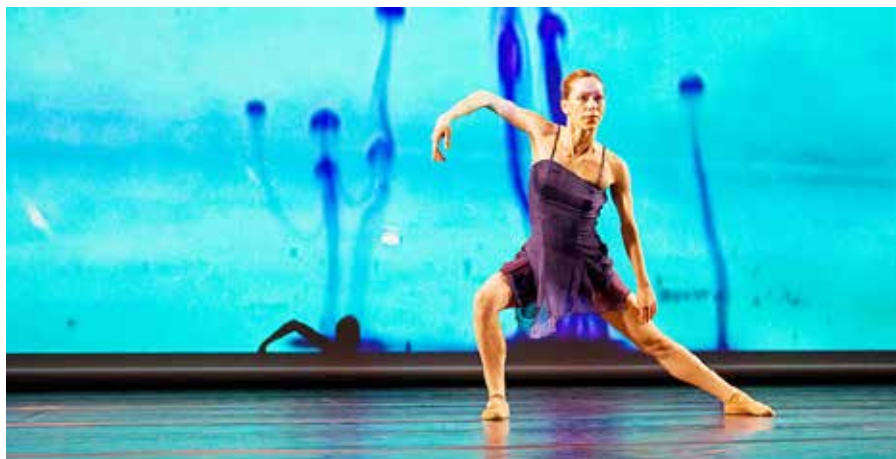
Journée Internationale de la Danse 2010 à Paris, France

Votre créativité est encouragée. De nombreuses idées peuvent être développées pour la célébration de la Journée Internationale de la Danse. Il existe déjà des blogs que vous pouvez trouver sur Internet.