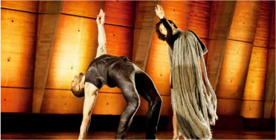
Journée Internationale de la Danse 2014 à Paris, France

Le principal enjeu de la Journée Internationale de la Danse est de promouvoir la "danse" sous toutes ses formes auprès des professionnels et des gens du monde entier. Parmi les autres buts et objectifs, on peut citer