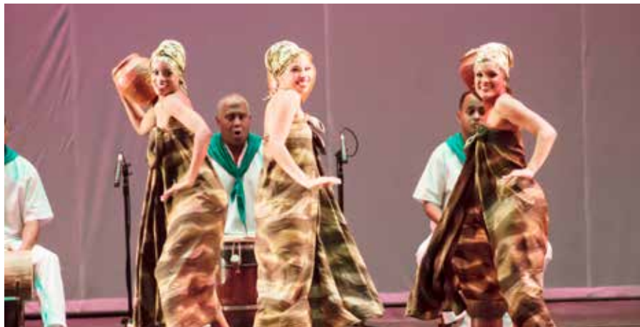
Dahomeñó par Folklorico Nacional de Cuba, Journée Internationale de la Danse 2018 à La Havane, Cuba

Les Centres ITI, les membres coopérants et les amis sont encouragés à envoyer le Message de la Journée Internationale de la Danse aux médias de toute nature. Les auteurs sont en général disposés à donner des interviews. Si une agence de radio, de télévision, de presse ou d'Internet souhaite interviewer l'auteur du Message, veuillez prendre contact avec le Secrétariat général à l'adresse suivante : idd@iti-worldwide.org