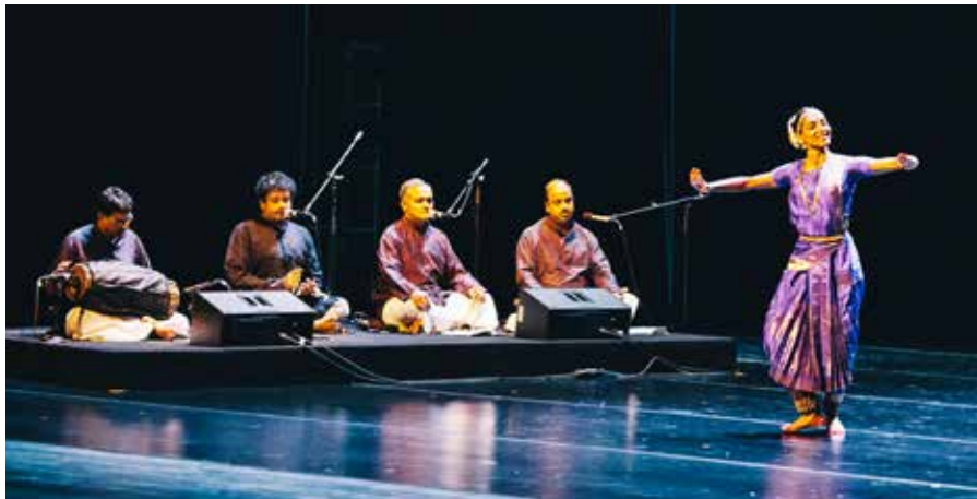
Shantala Shivalingappa à Journée Internationale de la Danse 2017 à Shanghai, Chine

En raison de la multitude de langues qui existent dans le monde entier, et parce que le Message doit être compris par les habitants d'un pays ou d'une région, le Message de la Journée Internationale de la Danse est toujours traduit dans la ou les langues du pays et il en va de même pour la courte biographie de l'auteur.