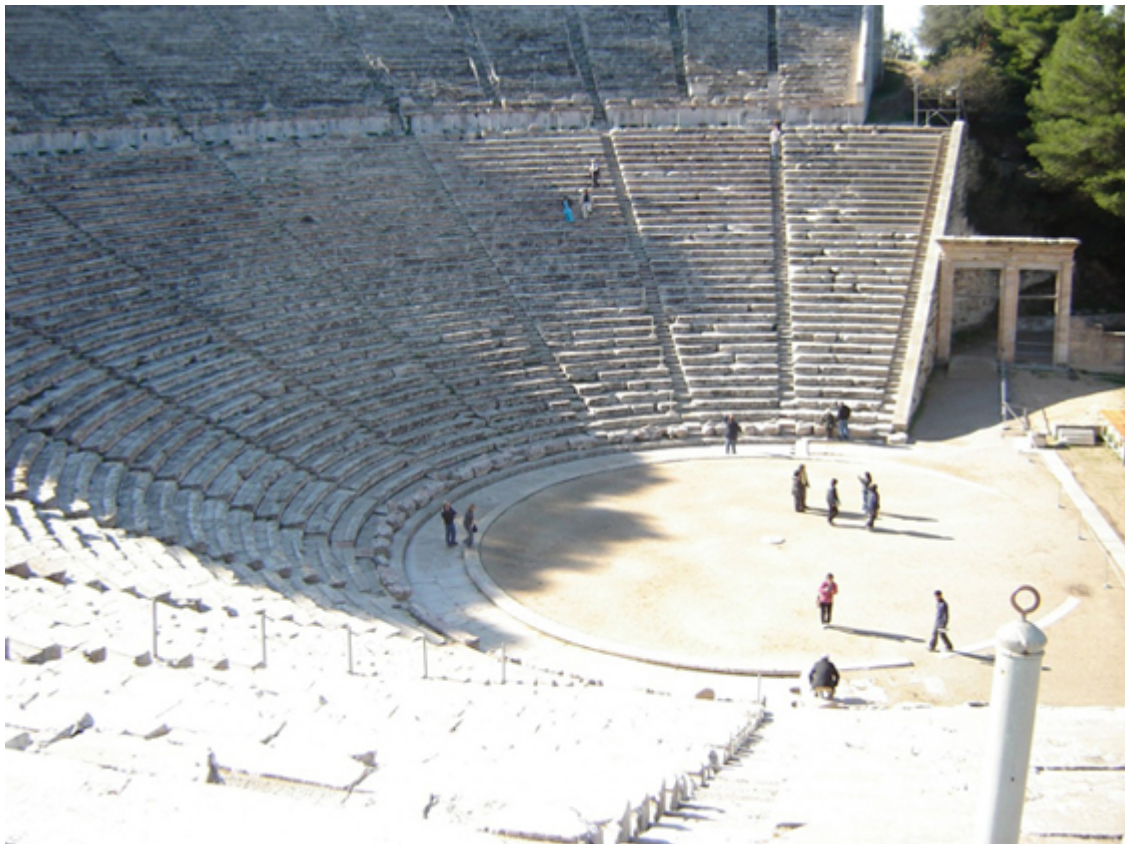
Amphithéâtre d'Épidaure, Grèce

Chers membres et amis de l'ITI, chers lecteurs,