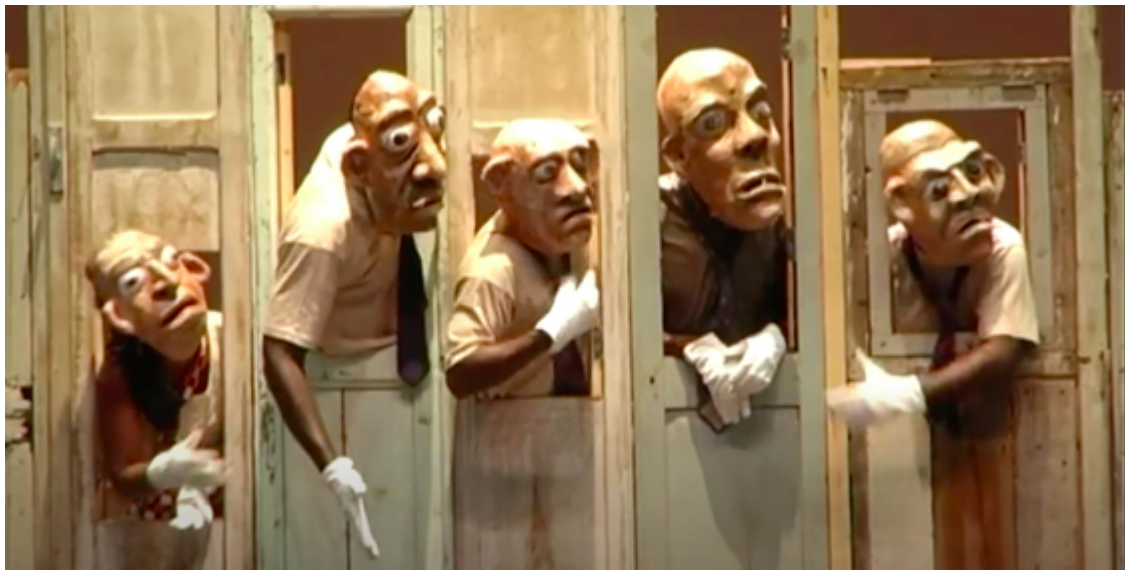
© Teatro Cenit, Nube Sandoval et Bernardo Rey, Colombie