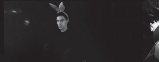
Curva Peligrosa Original de Edoberdo "Pelo" Galindo Compañía Infantil y Juvenil "Espiral Rebelde" Euzemárica, 2017 Escalera Producciones Teatro