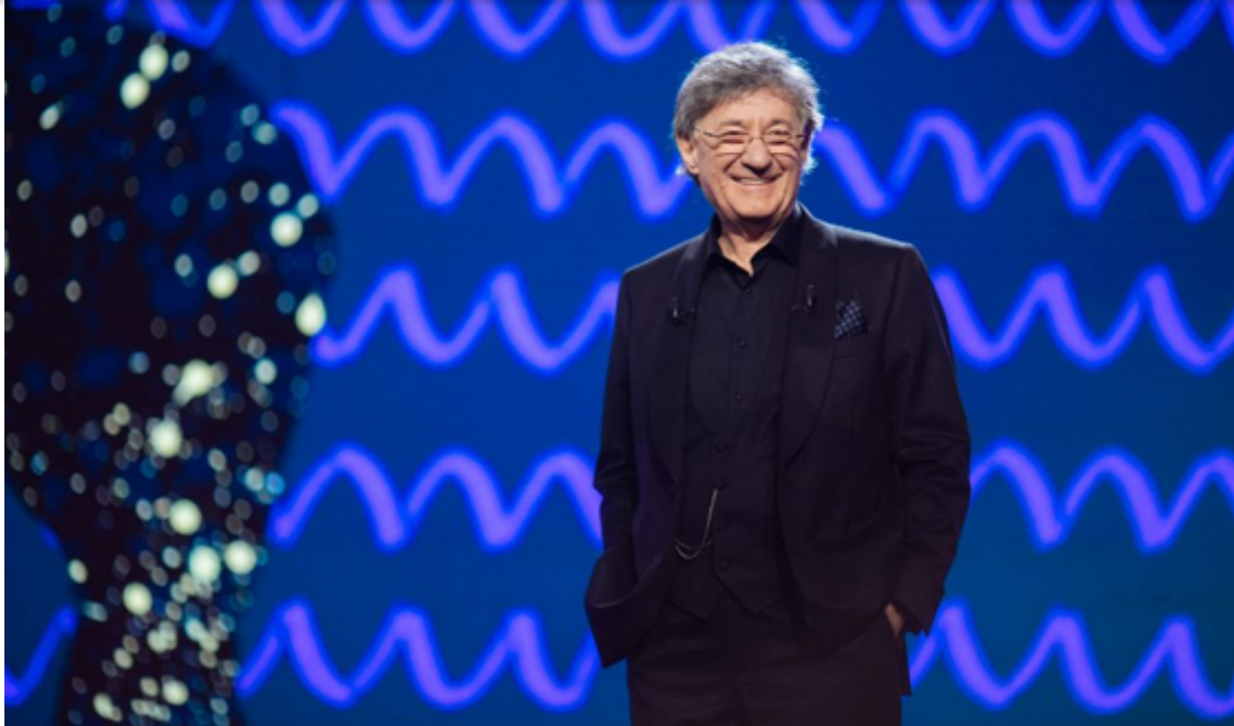
Ion Caramitru durant le UNITER Gala 2020