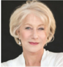
Helen MIRREN, Royaume-Uni