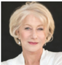
Helen MIRREN, Royaume-Uni