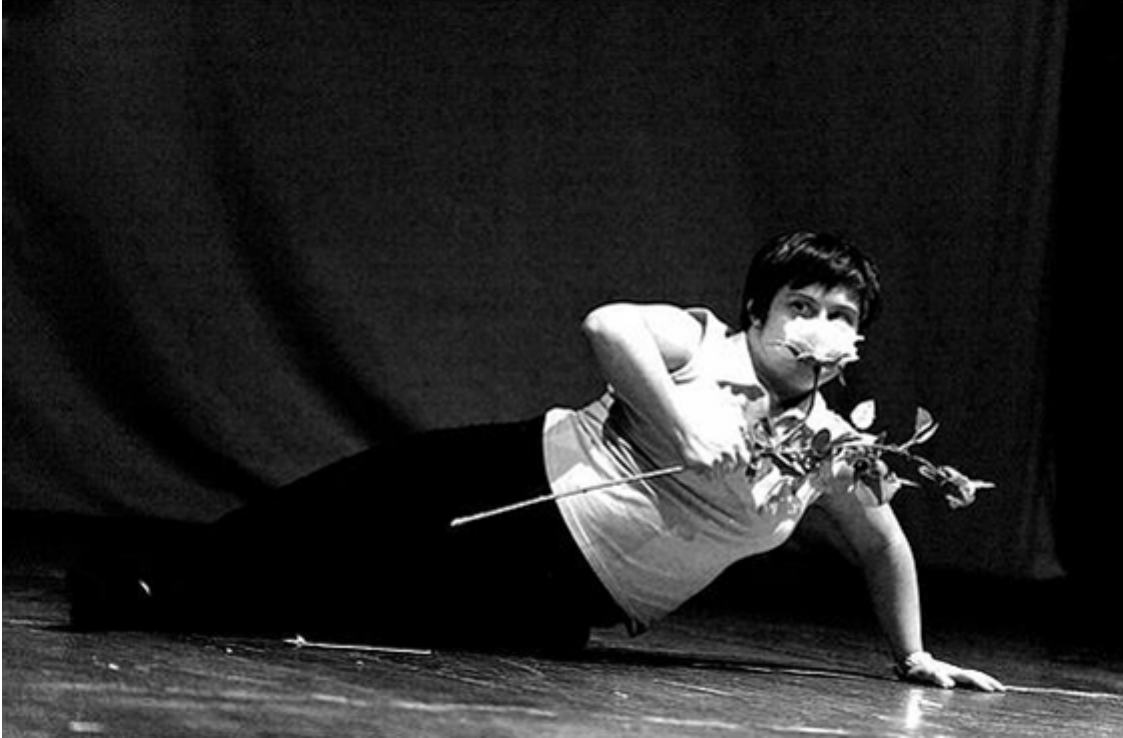
© Compagnia Volo Libero In forma di rosa. Ph. Franco Deriu

Le Théâtre de l'Université Aenigma de l'Université Carlo Bo d'Urbino reçoit le Prix International de l'inclusion 3.0 à l'Université de Macerata