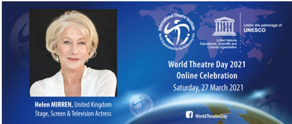
Helen MIRREN , United Kingdom Stage, Screen & Television Actress

Lettre d'information pour les Membres de l'ITI