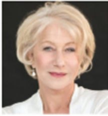
Helen MIRREN, Royaume-Uni