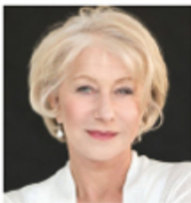
Helen MIRREN, Royaume-Uni