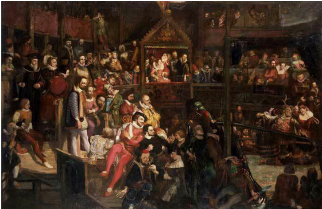
La reine Élisabeth regardant la performance des Joyeuses épouses de Windsor au Globe Theatre. Peinture à l'huile de David Scott, 1840, collection du Musée Victoria & Albert.

Afin de porter cet enjeu sur le débat public, SIBMAS a préparé une pétition en ligne sur le site internet change.org : http://chnng.it/HFgsGKXdyv