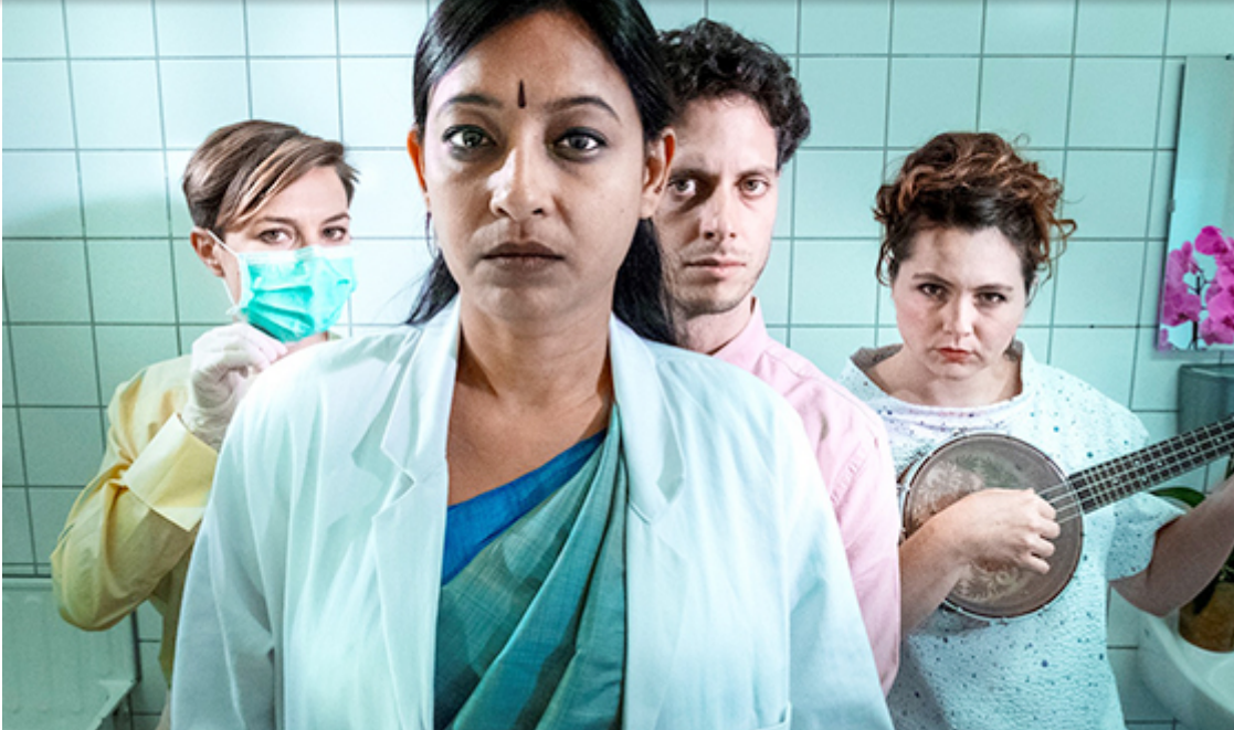
Flinn Works : Global Belly