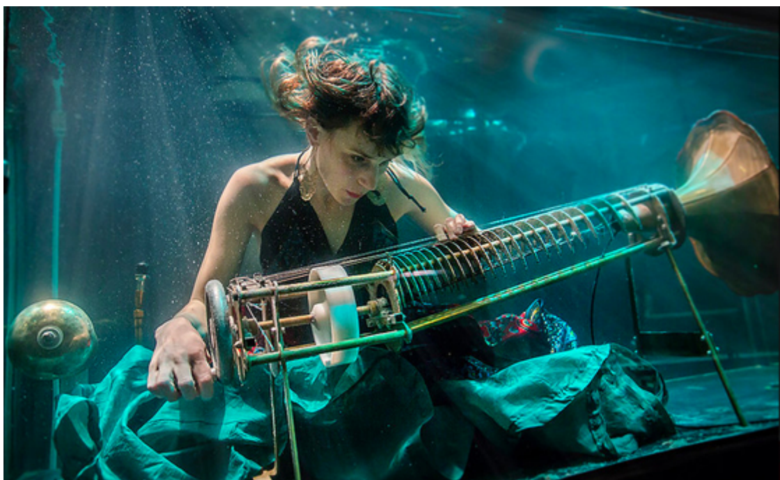
« Aquasonic Live » de Between Music : l'un des lauréats du concours de 2018.