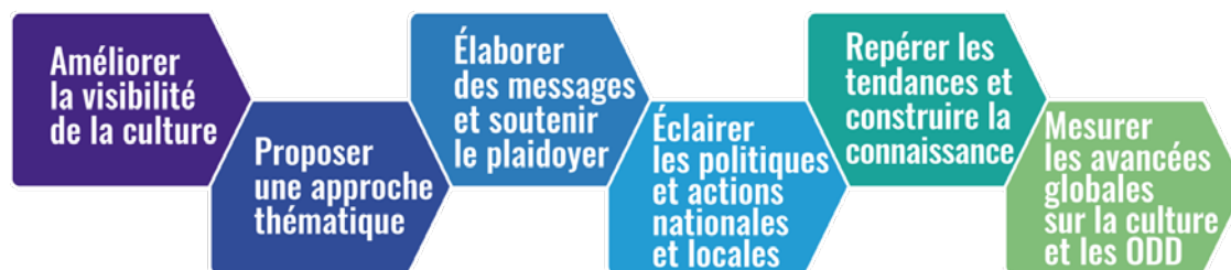
Figure 1. Logique des Indicateurs Culture|2030

Les informations collectées dans les villes et pays pilotes, dans le cadre de la mise en œuvre des Indicateurs Culture|2030, offriront une base de référence pour mesurer les avancées réalisées et engager des actions aux niveaux local et national. Les données offriront également un aperçu général de la progression de la contribution de la culture au Programme 2030 et fourniront des éléments concrets et le matériel analytique nécessaire pour nourrir les rapports préparés par l'UNESCO dans le cadre du suivi de la mise en œuvre au Programme 2030 au sein du Système des Nations Unies, ainsi que du suivi des Résolutions de l'Assemblée générale relatives à la culture et au développement.