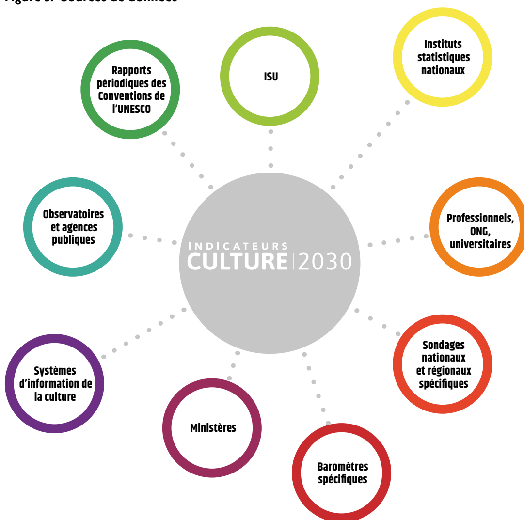
Figure 3. Sources de données