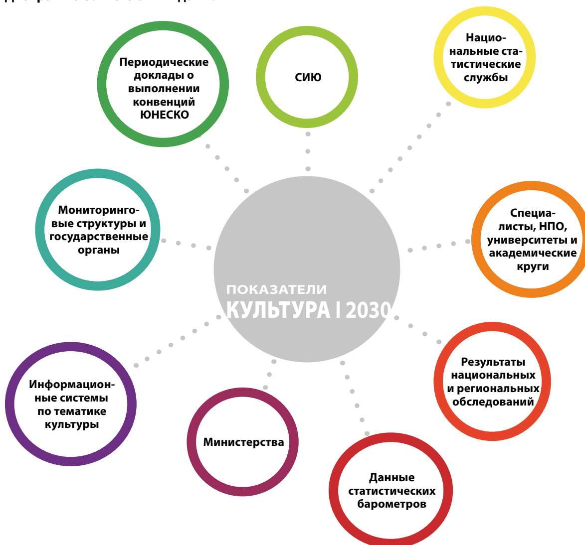
Диаграмма 3. Источники данных